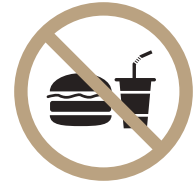
음식물 반입 금지

피트니스 내에서 회원에게 갑압적인 선물, 향응의 제공이나 대가성의 물품 요구는 절대 불허합니다.