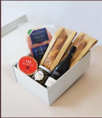
L'ensemble Signature français 프랑스 시그니처 세트

구성 파스칼 부샤드 부르고뉴 750ml 메종 마크 프랑스 꼬니송 210g 르므니에 치즈 까망베르 250g 잠봉 드 파리 슬라이스 200g 메르게즈 500g 몽상클레르 바게트