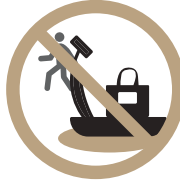
기구 선점 금지