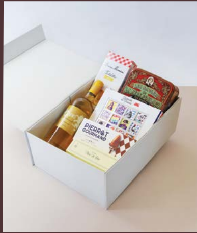
Les Confiseries Set 사탕, 초콜릿, 과자 세트

구성 사또 쉬드로, 라이온즈 드 쉬드로 750ml 피에로구르망 밀크 카라멜 맛 롤리팝 130g 라메르폴라르 사브레 쿠키 틴 250g 분마망 레몬 타르트 125g 몽상클레르 에클레어 르 쇼콜라 데 프랑세 초콜릿 16g